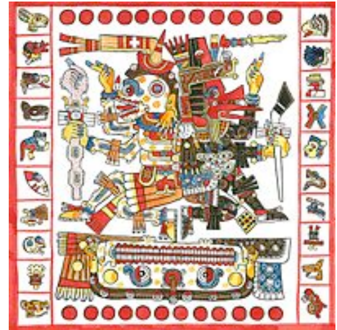
Códice de Borgia (Códice Yoalli Ehécatl) Museo del Vaticano