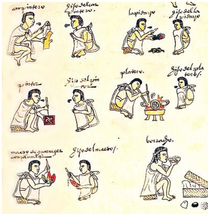
Segunda tira del Códice Mendocino "Los tlacuilos" Universidad de Oxford