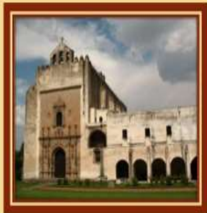
San Agustín en Acolman, en México, siglo XVI ejemplo del orden agustino

Se ampliaron al oriente del actual estado de Guerrero, unidas a México a través del de Morelos y al suroeste del de Puebla. Conservan una gran unidad arquitectónica en torno al plateresco. Parece que esta veintena de conventos se hubieran propuesto (y es muy probable que los frailes constructores se lo propusieron) aplicar al pie de la letra los principios ideológicos de los Reyes Católicos y de Carlos V: es decir que los agustinos hicieron una estética de estado al construir sus primeros conjuntos conventuales con esa misma unidad temática, estructural, arquitectónica y estilística.