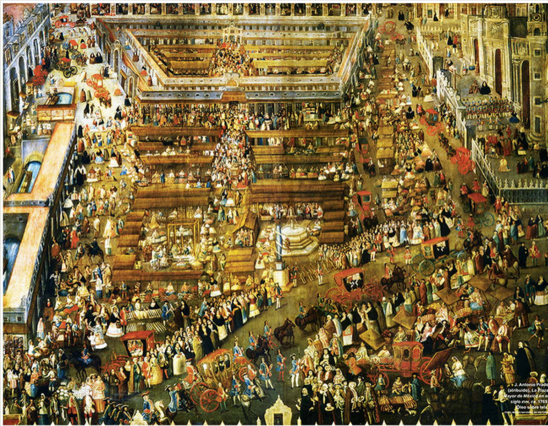
J. Antonio Prado (atribuido), La Plaza Mayor de México en el siglo xvii, ca. 1769. Óleo sobre tela. Museo Nacional de Historia